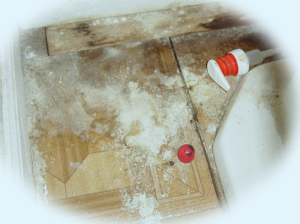
Fotografía por: January E. Jones, Mejorando el ambiente para los niños

El moho es un desencadenante común del asma.