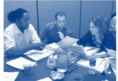
Asistentes del Décimo Aniversario de la Conferencia Nacional de Capacitación del Programa Redes de Vecindarios participan en uno de muchos talleres de trabajo adaptados para los interesados en el programa Redes de Vecindarios.

“Creo que la sesión fue uno de los mejores talleres de licitación de subvenciones al que he asistido”, indicó Harris, “y he ido a muchos. El aspecto que